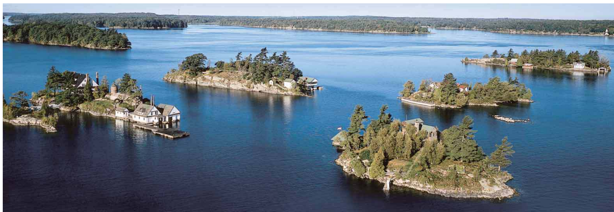
Warum Ontario übersetzt „Schönes Wasser“ bedeutet, wird bei einer Schifffahrt durch die „Thousand Islands“ deutlich.