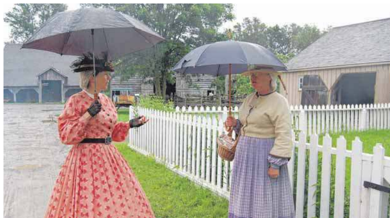
Dorfkutsch anno 1860 – zu erleben im Museumsdorf Upper Canada Village.

Informationen zu Ontario im Internet auf www.ontariotravel.net/de und www.ottawatourism.ca Broschüren- und Infos telefonisch unter 089/689063837. Für die Einreise ist ein gültiger Reisepass erforderlich. Die vorgestellte Reise wurde unterstützt von Ontario Travel.